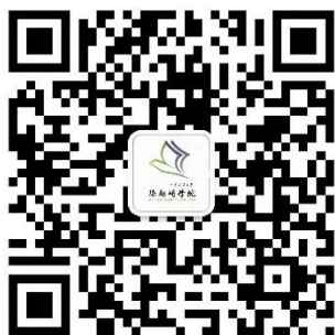
孙越崎学院微信公众号

线上唯一官方咨询：“2024孙越崎学院入校选拔咨询”QQ群，群号：854299967。